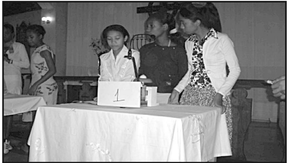
Fifaliana ho an'ny mpianatra, ny mpampianatra ary ny raiamandreny ny fiatrehana sy fahavitan'ny andron'ny SALOMA ny 13 - 16 Mey 2010.